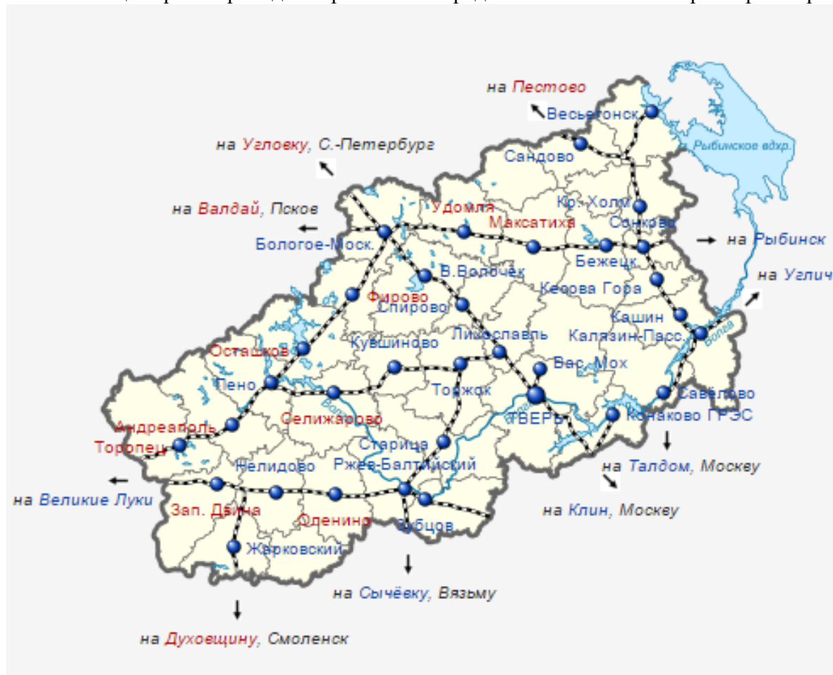
Рисунок 2 Схема транспортного обслуживания Тверской области в части железнодорожных перевозок.

*** - в настоящее время проводится работа по определению объемов и параметров перевозок